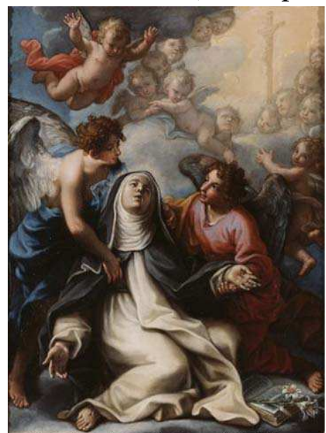
Giovanni Odazzi, Estasi di S. Teresa d'Avila, XVII sec.